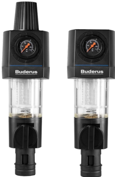
Figure 1: Logafix water filter with and without pressure reducer