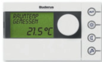
Bedieneinheit Logamatic RC35

Kombinieren, erweitern, modernisieren: Mit dem Logamax plus GB162 eröffnen sich Ihnen alle Möglichkeiten. Denn er ist ein perfekter Teamplayer, wenn es etwa darum geht, die Kraft der Sonne mit einzubeziehen. Oder Festbrennstoffe wie Holz oder Pellets. Alles ist schon so gut wie geregelt.