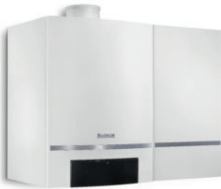
Logamax plus GB162 mit 40-Liter-Schichtladespeicher

Der Logamax plus GB162 spart nicht nur eine Menge Energie, sondern auch Platz. Sein überaus kompaktes Format ist ein Riesenvorteil für Sie, denn jeder gesparte Zentimeter bringt umso mehr Freiheit bei der Wahl des Aufstellungs-ortes. Das Gerät passt in viele Nischen und Ecken und überzeugt durch denkbar einfache Montage. Und das besondere Plus: Auf Wunsch verwöhnt Sie der Logamax plus GB162 auch noch mit sehr hohem Warmwasserkomfort.