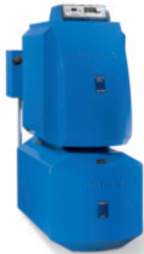
Logano plus GB225 mit Warmwasserspeicher Logalux LT

Der Logano plus GB225 beweist echte Größe – und ist dabei so bescheiden: Mit einem Leistungsbereich bis 74 kW ist er die Idealbesetzung für Mehrfamilienhäuser und kleinere Gewerbeimmobilien. Und obwohl er in puncto Energieeffizienz die Hauptrolle spielt, drängt sich das Raumwunder nicht in den Vordergrund. Im Gegenteil: Mit rund 1 m 2 benötigt er nur wenig Aufstellfläche.