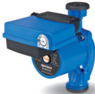
Effizienzpumpe Logafix BUE-ECO

Die Effizienzpumpe Logafix BUE-ECO lässt sich ganz einfach bedienen: über nur einen Knopf. So können Nachtabsenkung und Sollwert schnell und komfortabel eingestellt werden. Einen reibungslosen Start zu Beginn einer neuen Heizperiode gewährleistet die Effizienzpumpe durch ihr dreimal stärkeres Anlaufdrehmoment, denn es verhindert mögliche Startschwierigkeiten durch Verschmutzung. Dank neuartiger Elektronik ist sie zudem äußerst leise im Betrieb.