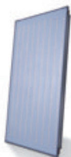
Logasol SKN 3.0

Einfach und effizient – von Anfang an: Mit Komplettlösungen von Buderus haben Sie nicht nur keine Mühe bei der Zusammenstellung Ihrer Heizungsanlage, sondern auch die Gewissheit, dass alles einfach optimal zueinander passt, für ein Maximum an Sonnenenergie. Und wenn Sie Ihr sonnen-erwärmtes Wasser nicht direkt nutzen können, speichern Sie es einfach in Ihrem Kombi- oder Warmwasser-Speicher. So einfach kann Wohlfühlen sein.