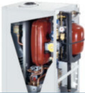
Komplette Solar-Unit integriert: Logamax plus GB152-24 T 170SR

Dieses Logaplus Paket hat es in sich: zum Beispiel höchsten Heiz- und Warmwasserkomfort bei geringem Platzbedarf. Und das besonders energiesparend und wirtschaftlich – dank der hocheffizienten Systemintegration von moderner Brennwert- und Solartechnik.