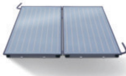
Logasol SKN 3.0

Das Logaplus Paket ist die Alles-drin-Lösung für höchsten Heizkomfort und die Trinkwassererwärmung mit Sonnenenergie. Und damit Sie auch tatsächlich die effizienteste Leistung herausholen, ist auch alles dran: Denn bei Buderus sind alle Heizkomponenten perfekt aufeinander abgestimmt – und die intelligente Solarsystemregelung ermöglicht sogar einen noch höheren solaren Ertrag. Das Ergebnis: Der Heizkessel muss weniger zuheizen, die Brennerstarts werden reduziert – und Sie sparen viel Energie. Übrigens: Was immer Sie in Zukunft vorhaben, bei Buderus, dem großen Systemanbieter, ergänzt sich alles ideal.